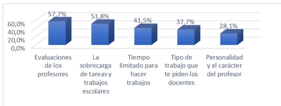
Figura 3. Estresores académicos